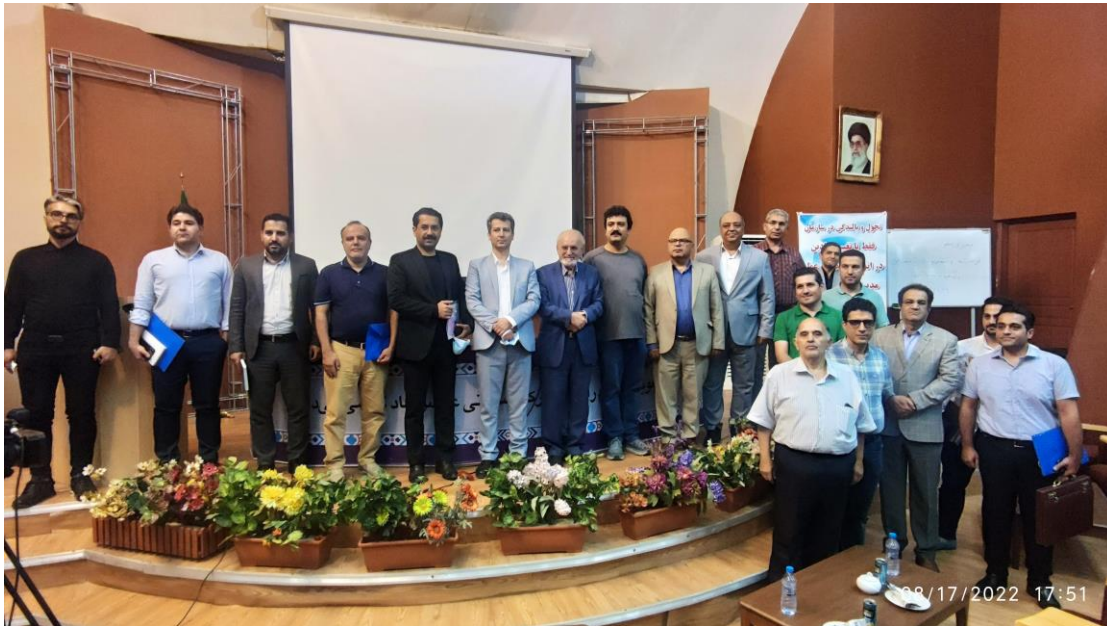
تصویری از شناسایی تهدیدات و فرصت ها در صنایع ایران سال ۱۴۰۱ در شهرک صنعتی عباس آباد مجری شرکت آریسان رادین فراز